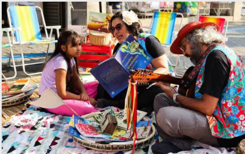
Passeio exclusivo para moradores acontece no dia 5 de abril e inclui roteiro por pontos turísticos

Ao longo de 2026, estão previstas novas edições mensais do City Tour. As datas de cada mês serão divulgadas nos canais oficiais da Prefeitura de Guararema. Para os passeios, é recomendado que os participantes utilizem roupas e calçados confortáveis e levem protetor solar e repelente.