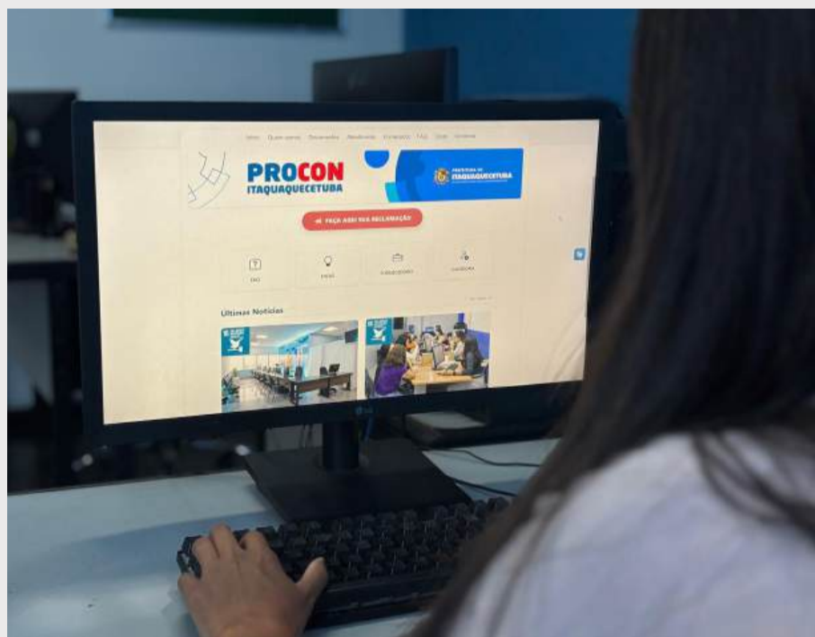
Nova plataforma permite abrir reclamações e solicitar informações de forma rápida, sem necessidade de deslocamento

A Subsecretaria da Defesa do Consumidor de Itaquaquecetuba lançou um novo sistema de atendimento online em alusão ao mês do consumidor. A ferramenta poderá ser acessada pelo novo portal Itaquá Digital: itaquaquecetuba.sp.gov.br/itaquadigital.