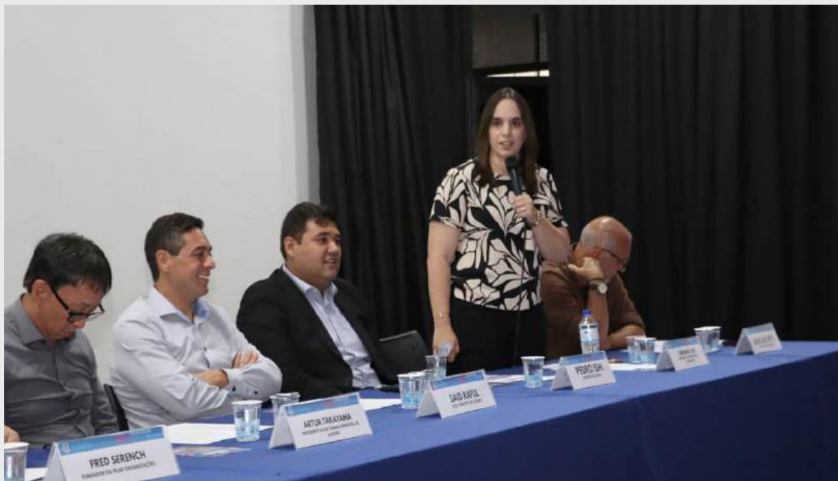
Serão colocados à disposição dez mil ingressos sociais para cada um dos quatro dias de festa mediante doações

às famílias que precisam desse apoio. Também pedimos que as pessoas fiquem atentas à validade dos produtos no momento da doação, para que possamos garantir que esses itens cheguem em boas condições a quem mais precisa. É uma oportunidade de participar do ‘Suzano Music Festival’ e, ao mesmo tempo, fazer o bem”.