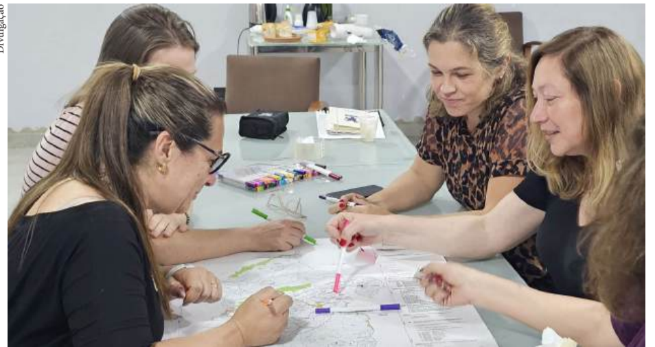
Encontro entre moradores discutiu e consolidou o esboço de propostas para melhorias no trânsito