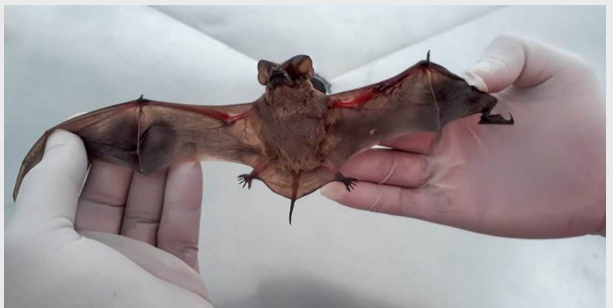
Unidade conquistou o 5º lugar na premiação "10+ Colaboradores SISS-Geo 2025"