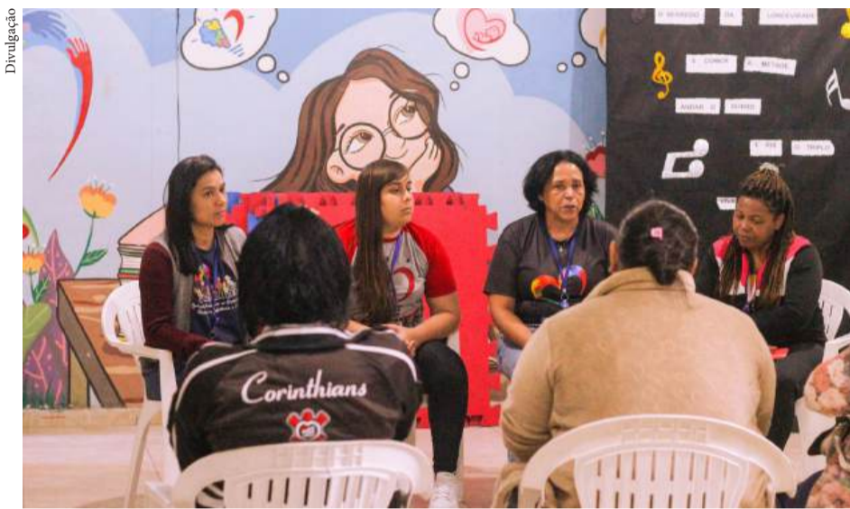
Projeto beneficia, diretamente e indiretamente, cerca de 750 pessoas e colabora para o fortalecimento da economia familiar no bairro Miguel Badra, em Suzano

“A Suzano acredita que o desenvolvimento do negócio precisa caminhar junto com o desenvolvimento das comunidades onde atua. Por