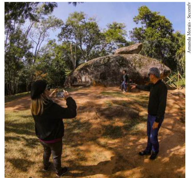
Município é o primeiro entre sete cidades do Alto Tietê que receberá as atividades

Um momento de muita alegria e diversão ocorrerá no Calçadão da XV de Novembro no sábado (21), das 14 às 18h. O Circuito Sesc de Artes vem chegando na cidade com oficinas diversas que garantem o desenvolvimento cognitivo dos participantes. Ao todo, sete cidades do Alto Tietê receberão as atividades, e Ferraz terá o pontapé inicial do projeto.