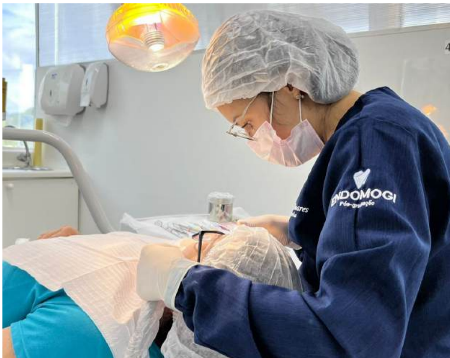
A APCD Regional Mogi das Cruzes destaca a prevenção e consultas regulares ao dentista

quadros já existentes. Dados da Organização Mundial da Saúde indicam que doenças bucais afetam cerca de 3,5 bilhões de pessoas em todo o mundo, sendo consideradas um dos problemas de saúde mais comuns globalmente, o que reforça a necessidade de atenção contínua ao tema. Diante desse cenário, a APCD orienta a adoção de medidas simples no dia a dia, como manter a hidratação, realizar a escovação após as refeições, utilizar fio dental diariamente e ficar atento a sinais como sangramento gengival e sensibilidade ao frio. Outra recomendação é a troca da escova de dentes após episódios de gripe ou resfriado, evitando a permanência de microrganismos. A entidade também destaca a importância das consultas periódicas ao cirurgião-dentista, que permitem o diagnóstico precoce e a prevenção de complicações, contribuindo para a saúde integral do organismo. A Associação Paulista de Cirurgiões-Dentistas - Regional de Mogi das Cruzes atua na valorização da odontologia no Alto Tietê, com oferta de cursos de especialização e atendimentos à população, ampliando o acesso à saúde bucal na região.