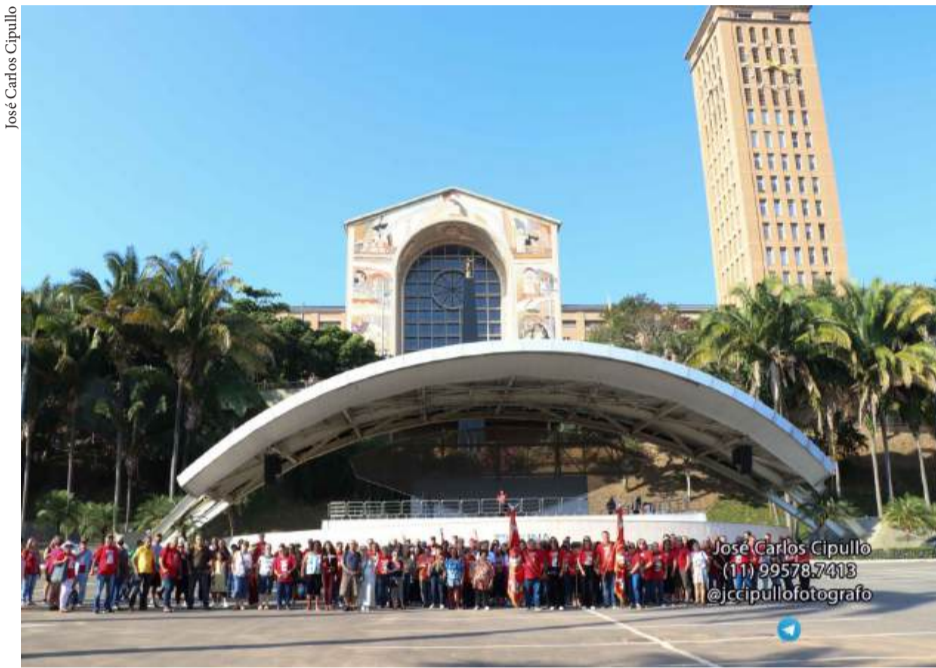
Romeiros terão missas e atividades voltadas à fé e devoção

A saída está programada para as 5 horas da manhã, com ônibus partindo de diversos pontos de Mogi das Cruzes, incluindo bairros como César de Souza, Vila Cintra, Jardim Universo, Brás Cubas, Jundiapéba, região central e também a cidade de Suzano. Até o momento, 21 ônibus já foram preenchidos, mas ainda há vagas disponíveis para os devotos interessados em participar. A expectativa é de mais de mil romeiros,