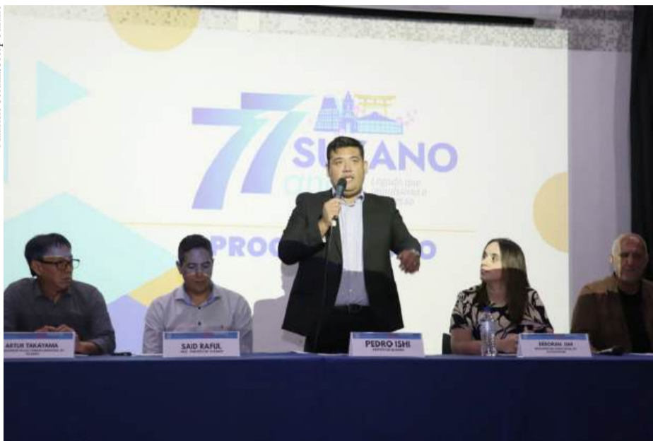
Prefeito Pedro Ishi fala sobre inauguração de obras, atividades culturais, lançamentos de programas e eventos de lazer para a população

rio de Suzano, enquanto as entregas da segunda unidade da Casa de Cultura de Palmeiras, da Unidade Básica de Saúde (UBS) do Parque do Colégio, da ampliação da Escola Municipal Professora Vera Lúcia Miranda, no Jardim